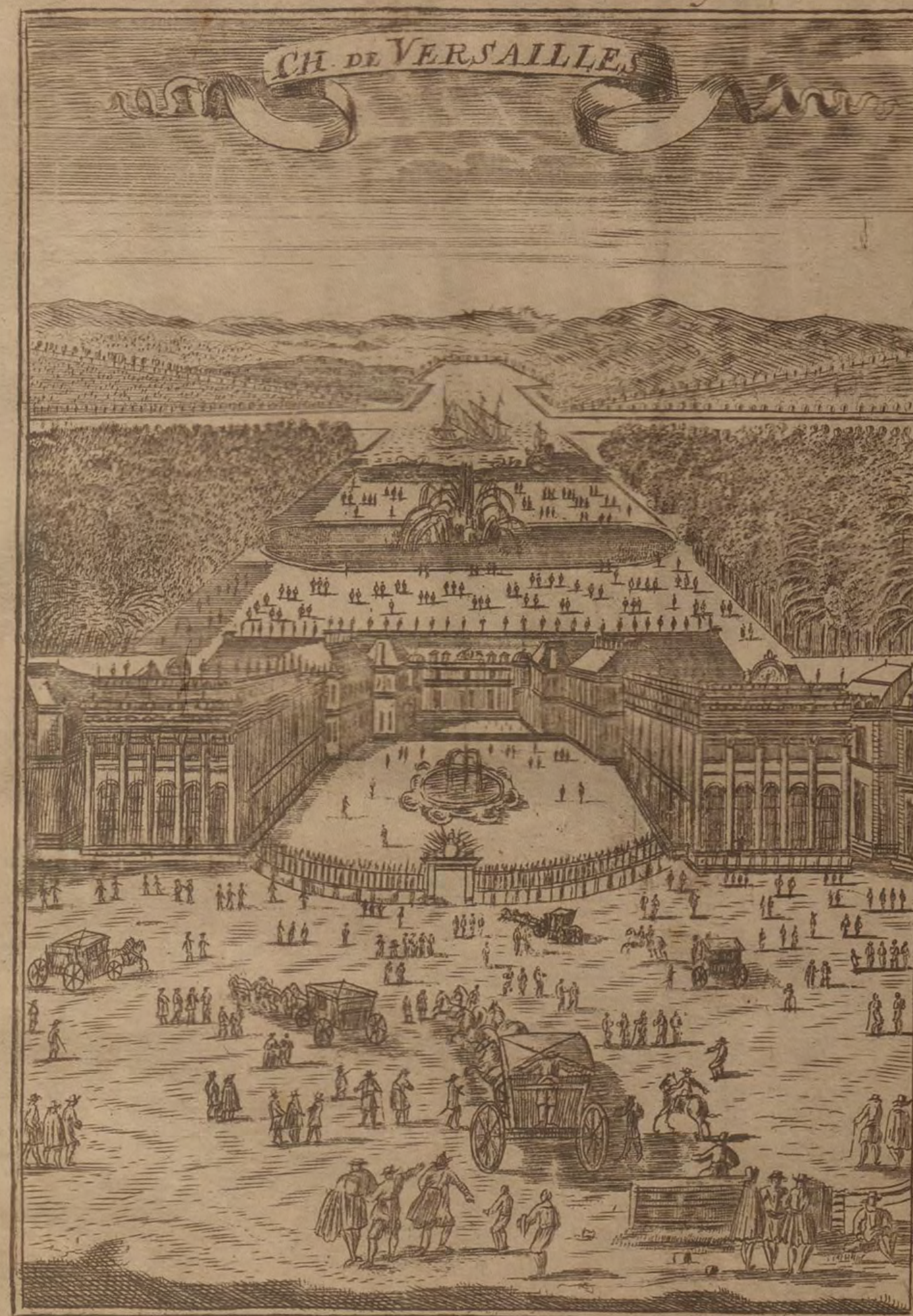
Das Schloß Versailles. Fig. LXX.