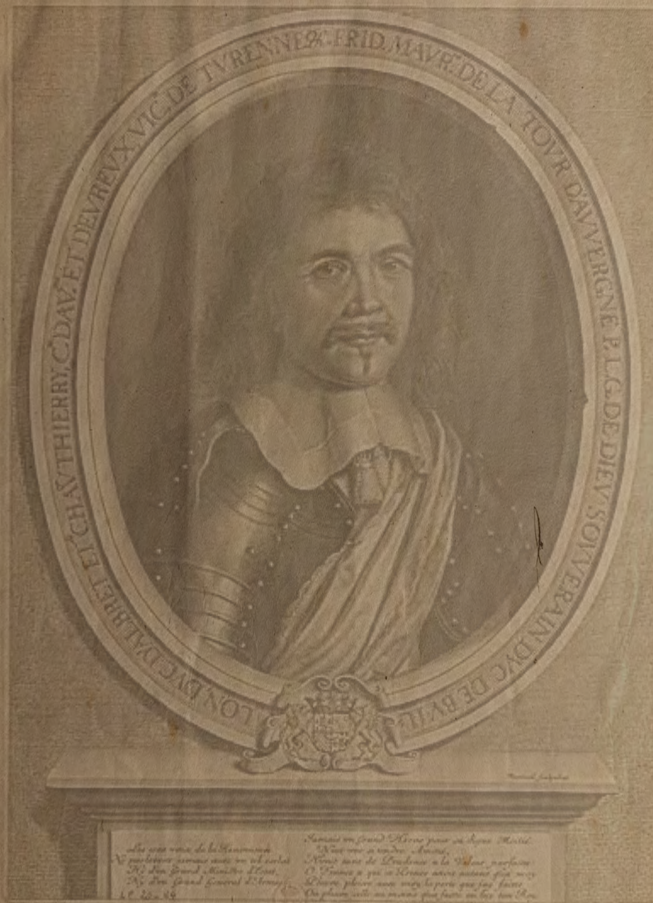
FRÉDÉRIC-MAURICE DE LA TOUR D'AVVERGNE, DUC DE BOVILLON, D'ALBRET ET DE CHÂTEAU-THIERRY (1605-1652)